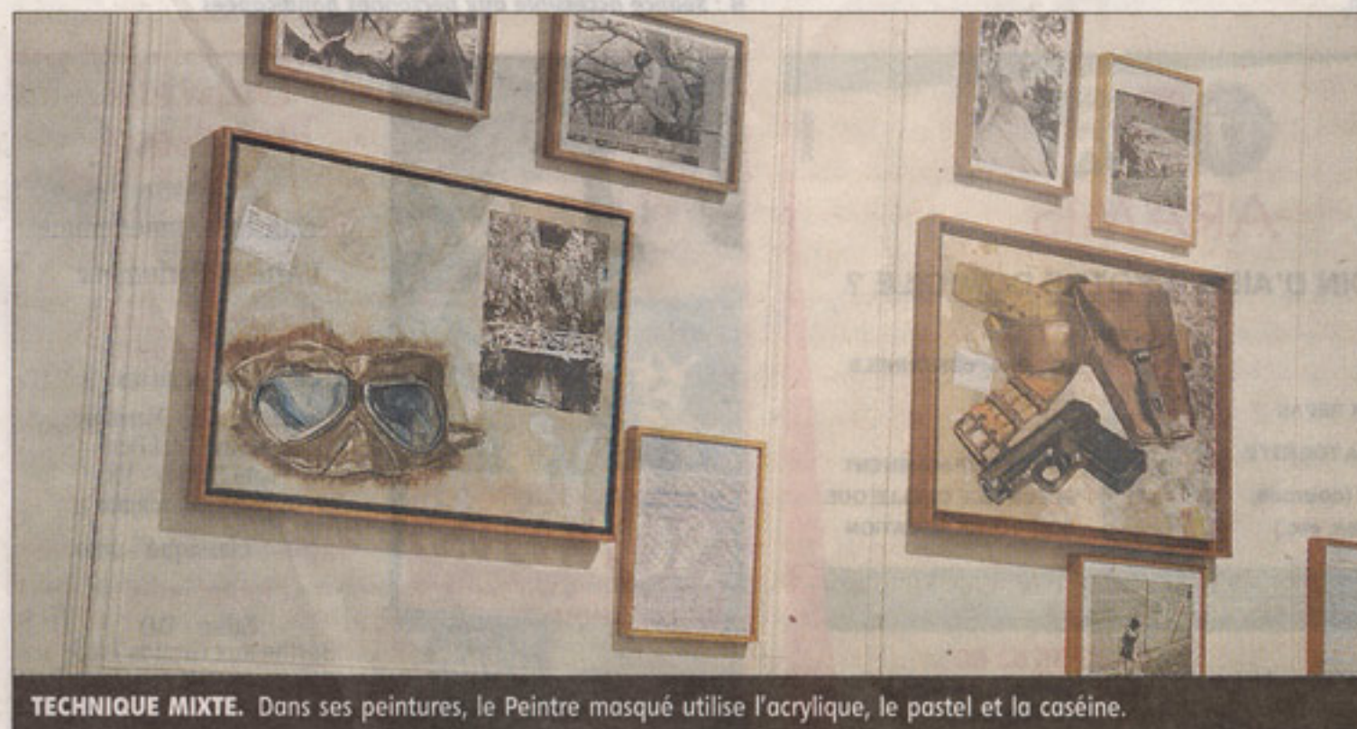
TECHNIQUE MIXTE. Dans ses peintures, le Peintre masqué utilise l'acrylique, le pastel et la caséine.

Indices. De l'aveu même du Peintre masqué, son identité est facilement trouvable. « Des indices sont glissés dans les textes. Internet fait le reste », commente-t-il.