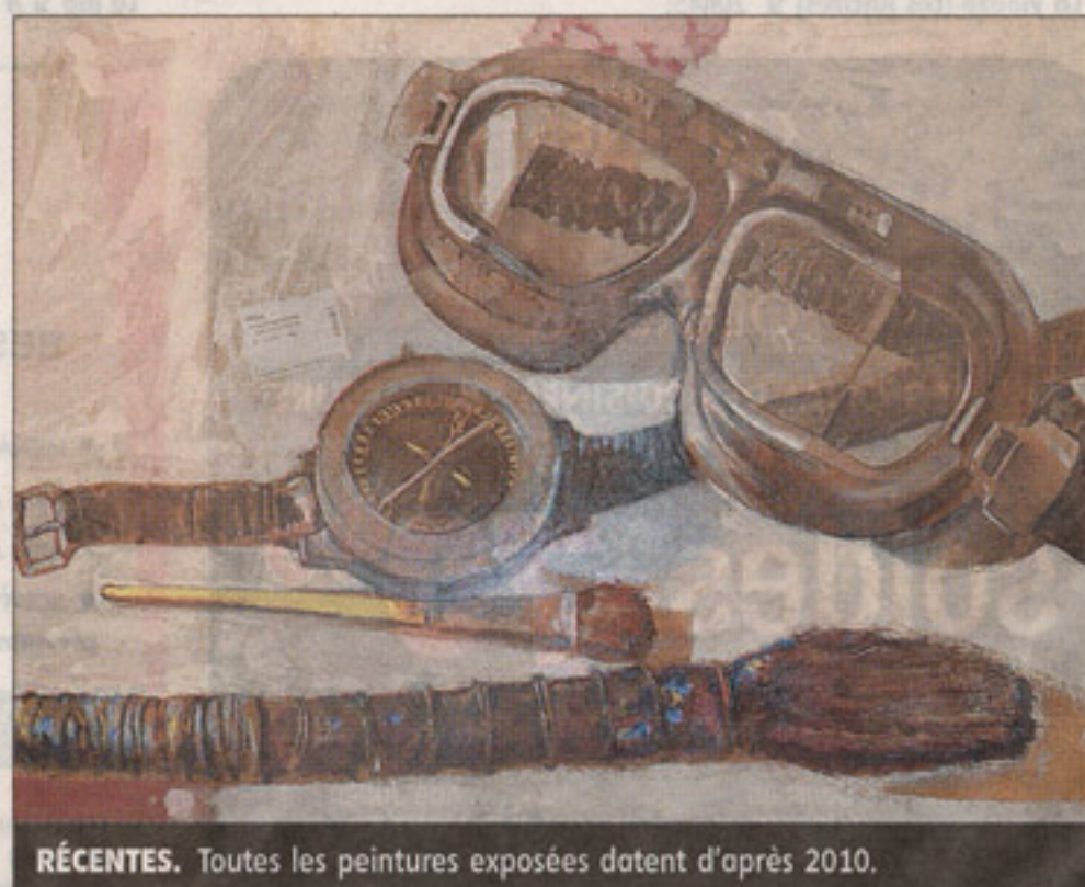
RÉCENTES. Toutes les peintures exposées datent d'après 2010.